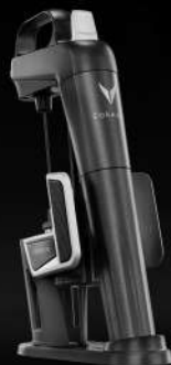
Coravin Model Two