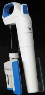
Coravin Model One

Il piacere di gustare qualsiasi vino senza togliere il tappo.