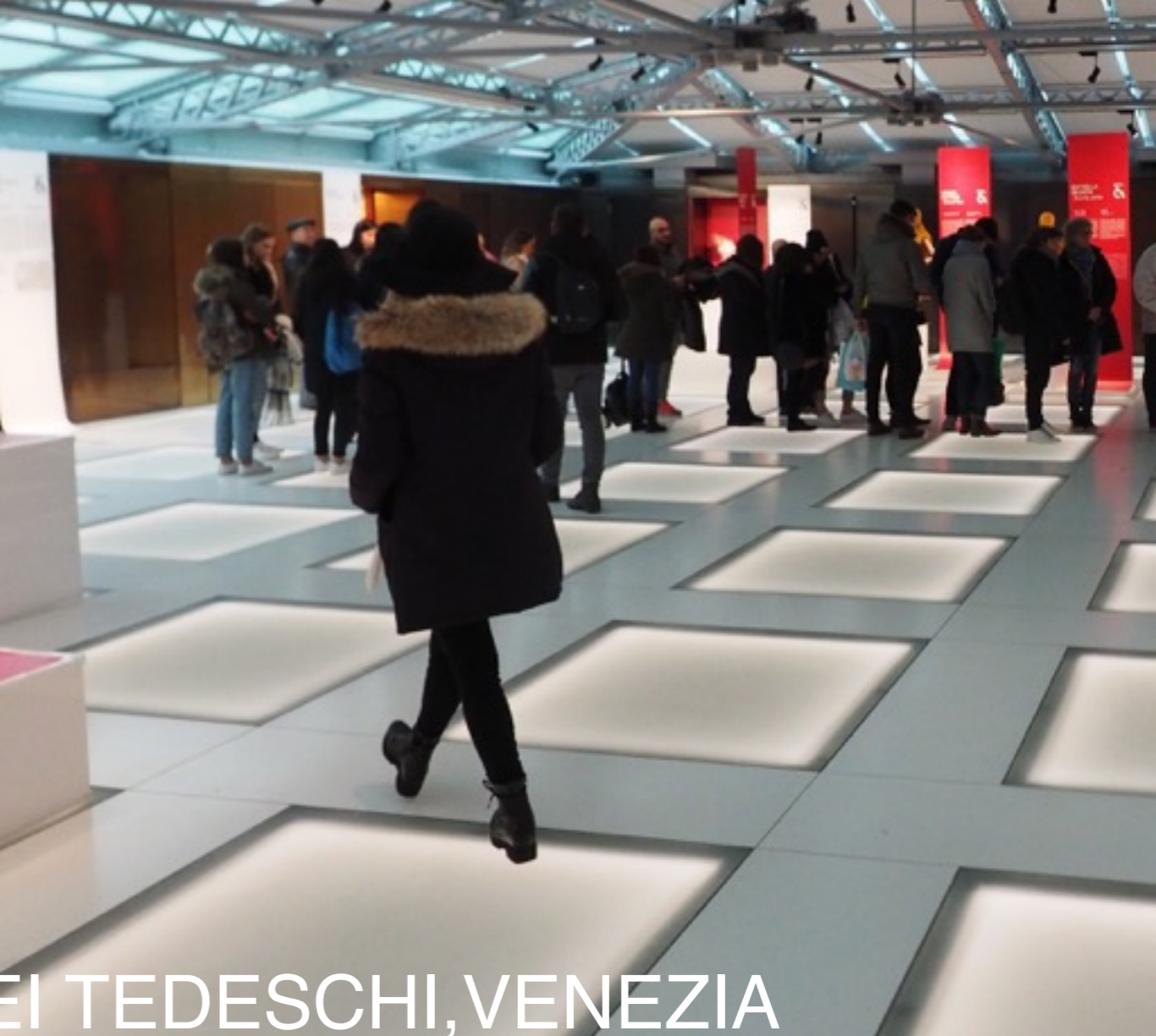
OMA - FONDACO DEI TEDESCHI, VENEZIA