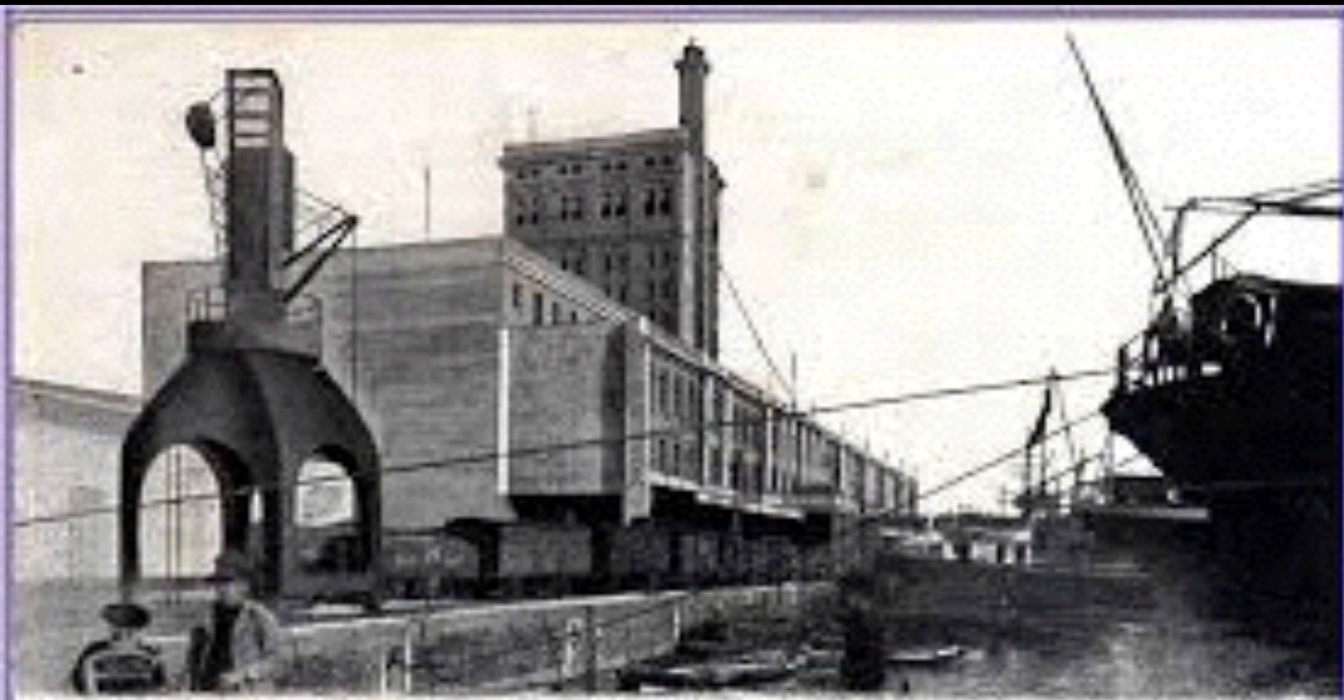
Genova - Silos Granari