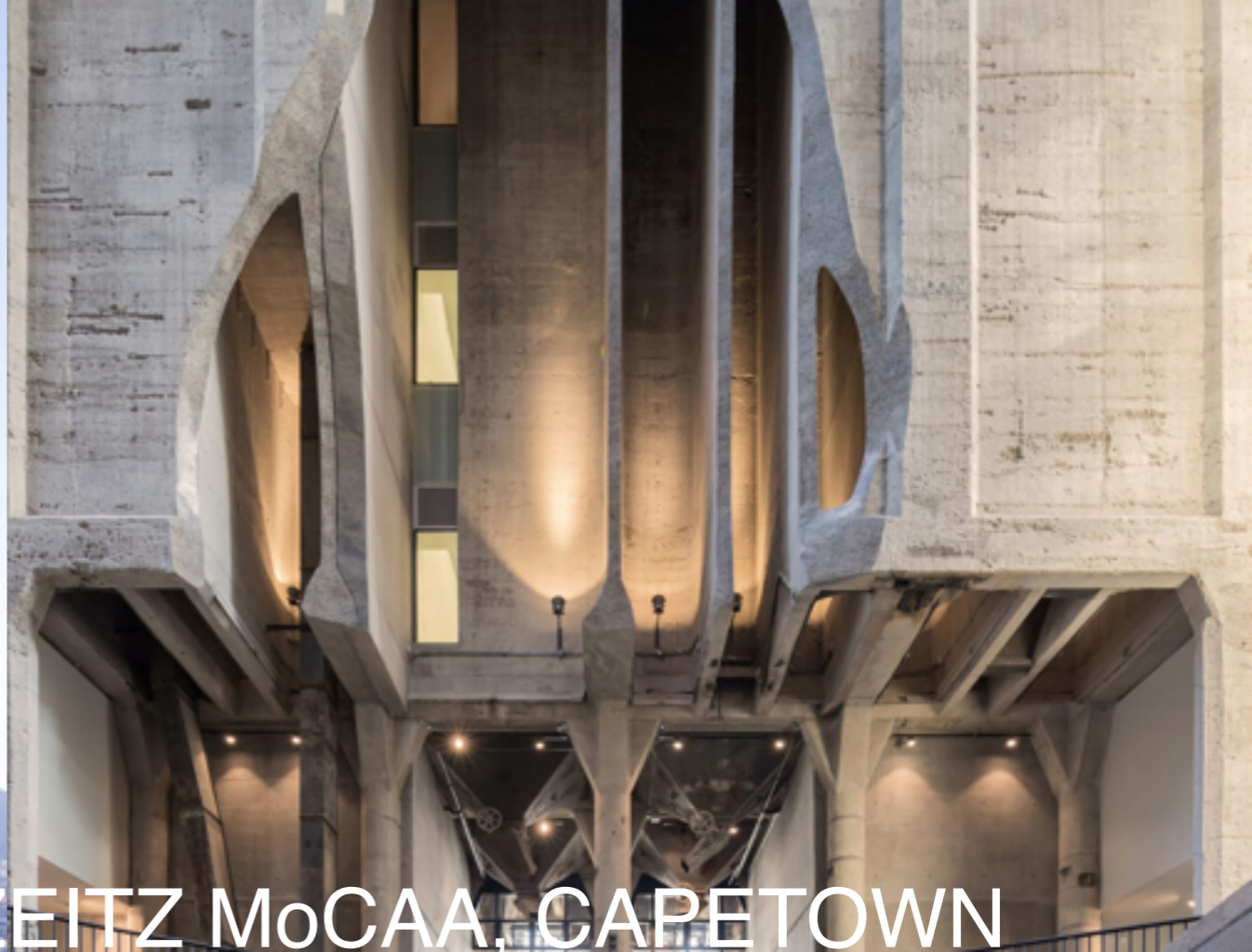
HEATHERWICK STUDIO - ZEITZ MoCAA, CAPETOWN