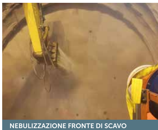
NEBULIZZAZIONE FRONTE DI SCAVO