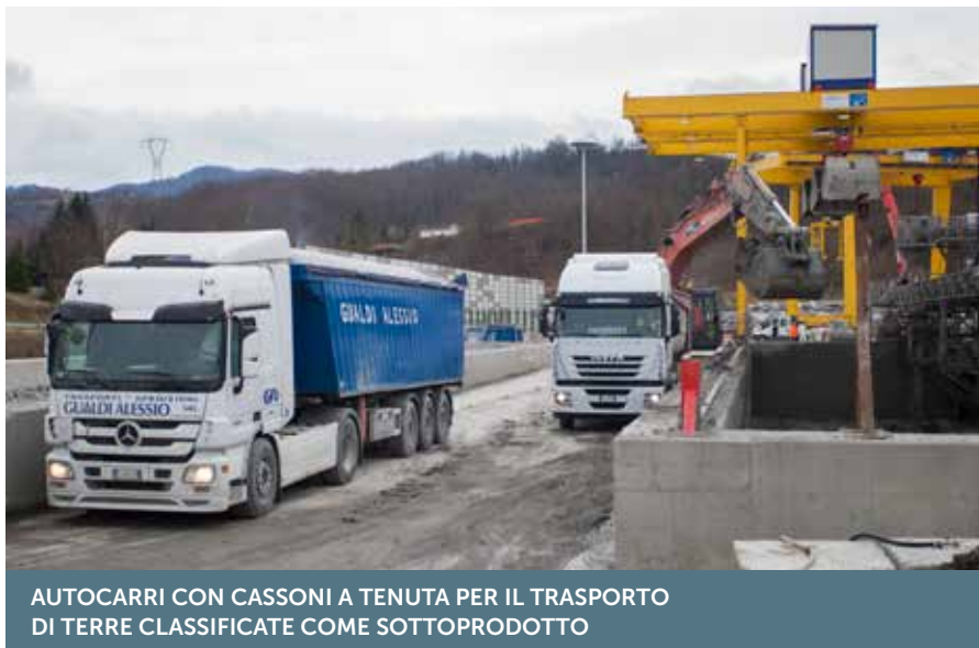
AUTOCARRI CON CASSONI A TENUTA PER IL TRASPORTO DI TERRE CLASSIFICATE COME SOTTOPRODOTTO

Il materiale trasportato ai siti di deposito autorizzati può quindi contenere eventuali quantità di amianto solo sotto la soglia di legge e, per limitare possibili dispersioni nell'ambiente durante il trasporto, vengono utilizzati autocarri dotati di cassone a tenuta e di teli di copertura. Allo stesso modo i cumuli di terre vengono gestiti nelle cave con modalità specifiche e controlli ambientali, per ridurre i rischi sia per i lavoratori che per l'ambiente.