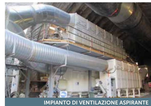
IMPIANTO DI VENTILAZIONE ASPIRANTE