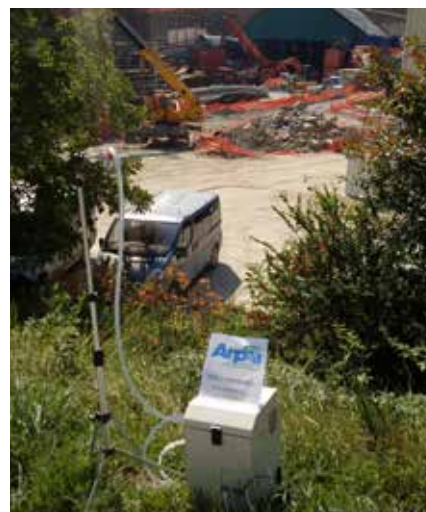
CENTRALINA POSIZIONATA ALL'INTERNO DI UN CANTIERE