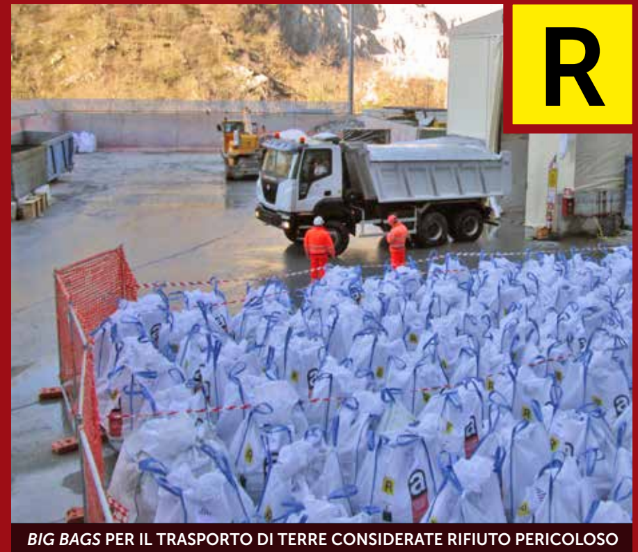
BIG BAGS PER IL TRASPORTO DI TERRE CONSIDERATE RIFIUTO PERICOLOSO