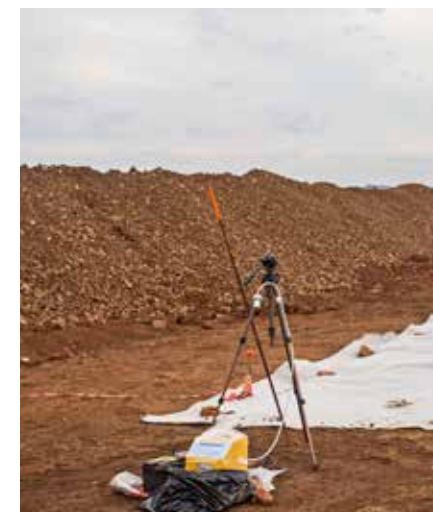
CENTRALINA POSIZIONATA ALL'INTERNO DI UN SITO DI DEPOSITO