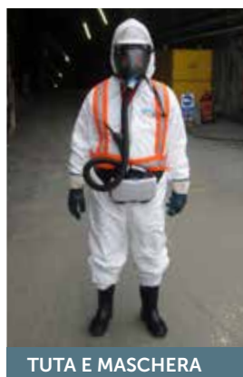
TUTA E MASCHERA