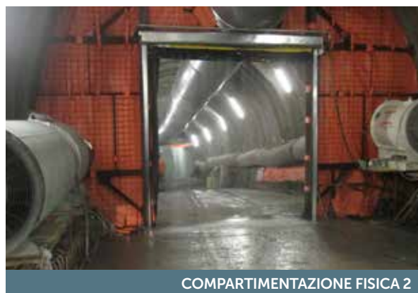
COMPARTIMENTAZIONE FISICA 2